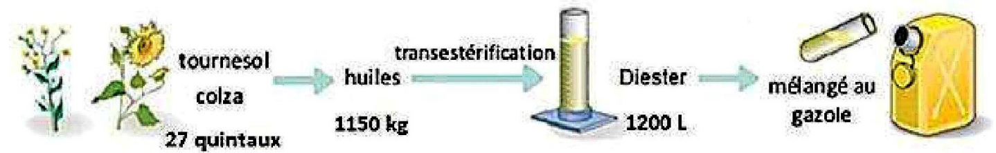
Schéma de la chaîne de fabrication d'un carburant à base de Diester®

Développé dans les années 80, le Diester® (marque déposée provenant de la contraction de « DIEsel » et « esTER ») est le nom donné au premier agrocarburant issu essentiellement de la transformation des huiles de colza et de tournesol, végétaux cultivés en France.